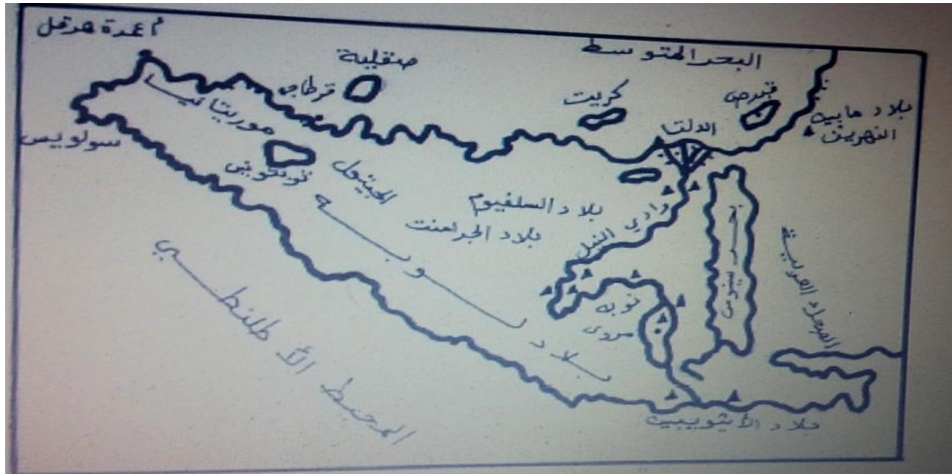
خريطة المغرب القديم حسب سترابون

سترابون: "تبدو ليبيا على شكل مثلث قائم الزاوية قاعدته تمتد على طول ساحل بحرنا الداخلي من مصر والنيل الى موريسيا واعمدة هرقل، اما الجانب العمودي عليها فيشكله النيل الممتد حتى اثيوبيا، والمقابل له يشكله كل شاطيء المحيط الذي بين الاثيوبيين والماوروسيين..".