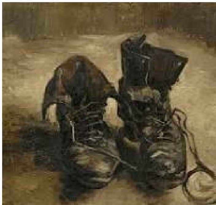
لوحة فان غوخ "الحذاء"

انظر https://youtu.be/noJzcUd1pbw https://youtu.be/noJzcUd1pbw