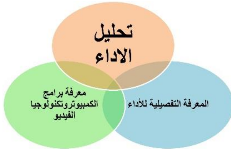
شكل يوضح متطلبات تحليل الأداء

ولكي يصبح تحليل الأداء الرياضي أكثر فعالية فإنه يحتاج إلى معرفة تفاصيل الأداء (المهارة)، ويتم ذلك من خلال إنشاء ما يُعرف بالملف الخاص بالمهارة الذي يحتوي على نوع النشاط الرياضي، طريقة الأداء التقني و الخططي، العوامل الخارجية المؤثرة في الأداء، المتطلبات البدنية، المتطلبات الفسيولوجية، المتطلبات البيوميكانيكية، والمتطلبات النفسية. وتكمن أهمية هذا الملف بالنسبة للمدربين في أنه أداة مساعدة لهم في تطوير فهم أفضل للمهارة من خلال تسليط الضوء على نقاط القوة ونقاط الضعف، وتوفير وسيلة لرصد التقدم المحصل ورصد فعالية برامج التدريب. بالإضافة إلى ذلك يتطلب تحليل الأداء الرياضي الإلمام بالوسائل والبرمجيات العلمية التي تساعد في تحليل الأداء وإعطاء قيمة علمية لهذا التحليل والشكل الآتي يوضح متطلبات تحليل الأداء الرياضي.