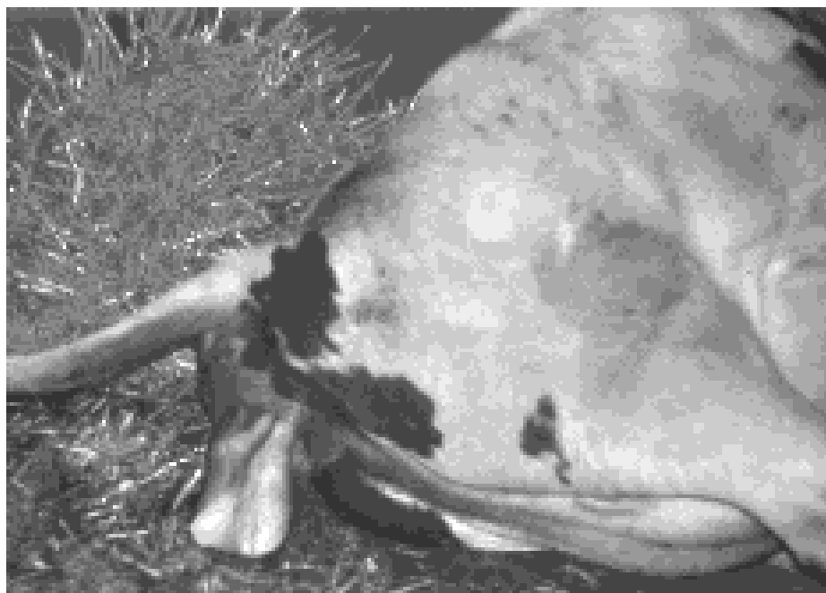
Figure 3: Naissance d'un veau.

Pendant la troisième phase, le placenta (arrière-fait) est expulsé de l'utérus. Après l'expulsion du veau, les contractions utérines continuent et aident à séparer le placenta des caroncules de l'utérus. Normalement, l'arrière-fait doit être expulsé moins de 12 heures après la naissance du veau.